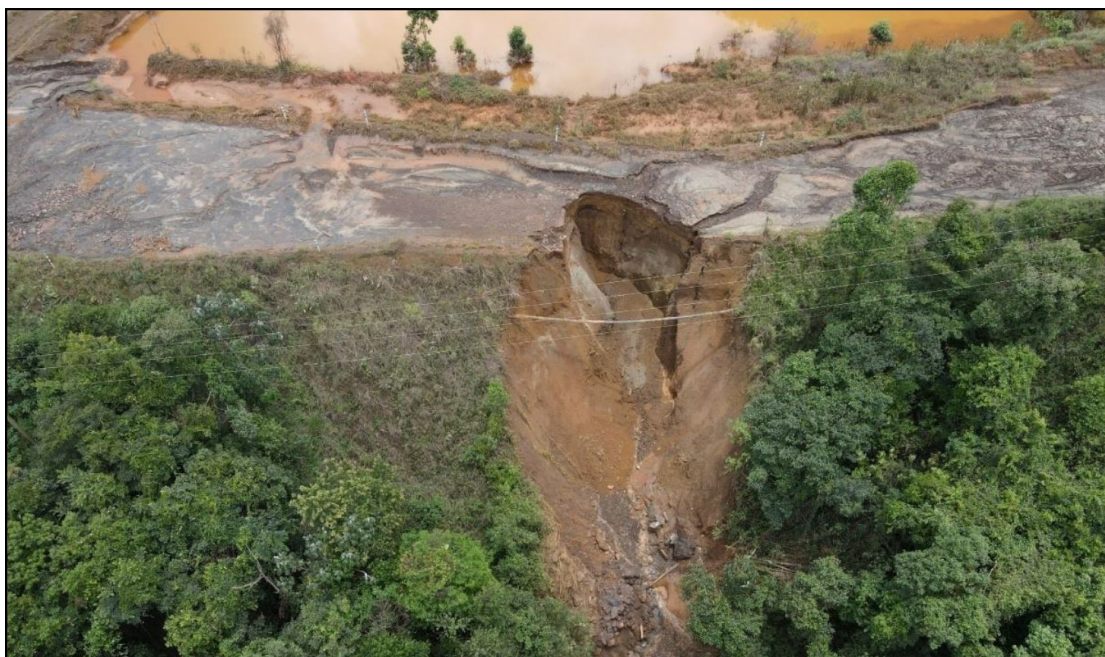
Figura 10 – Detalhe do colapso da borda da cava desativada