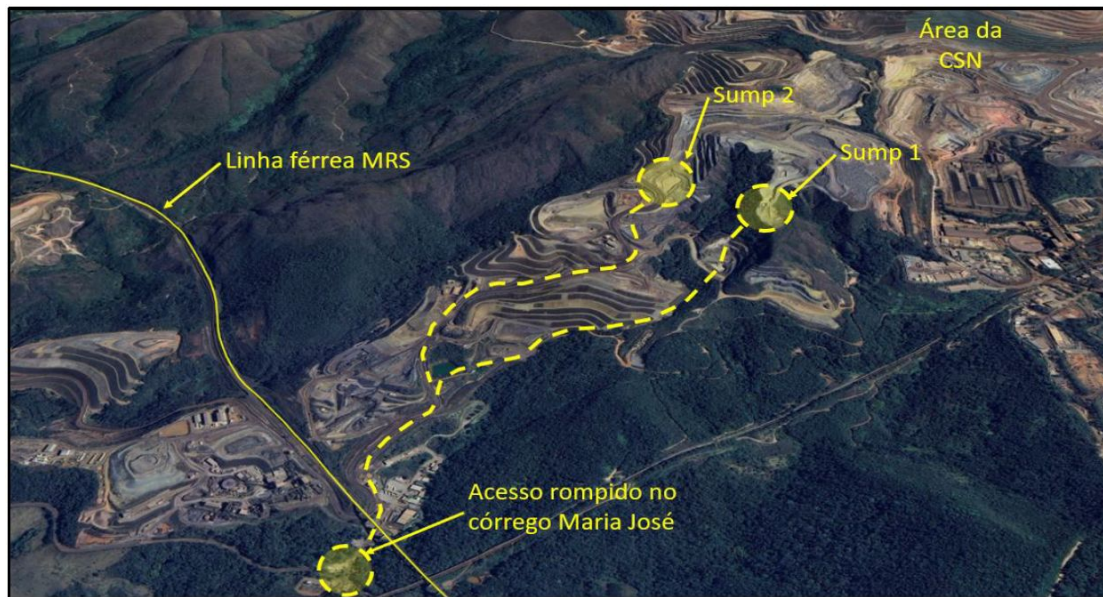
Figura 7 – Vista da Mina de Viga com a dinâmica do evento