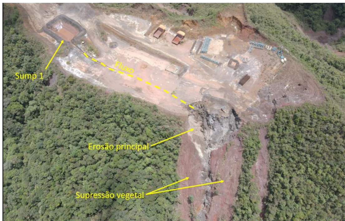
Figura 8 – Fluxo do extravasamento do sump 1