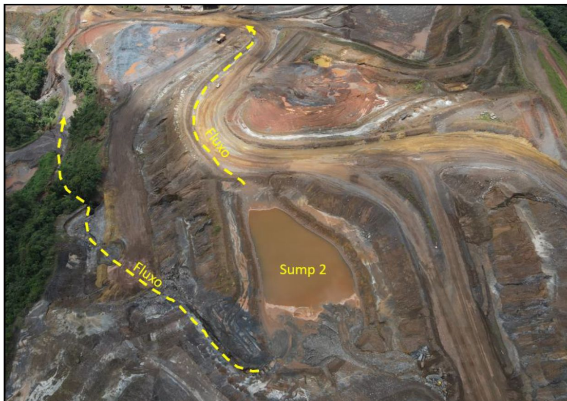
Figura 11 – Fluxo do extravasamento do sump 2