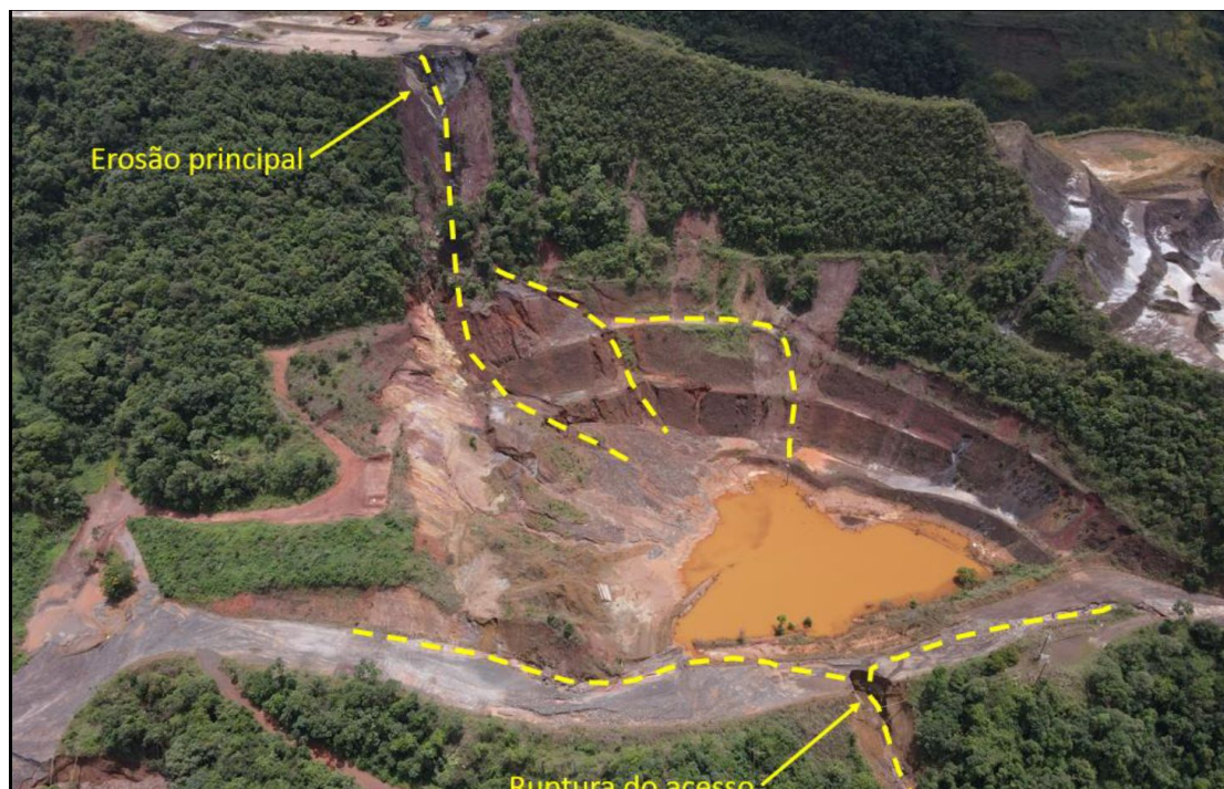
Figura 9 – Erosão no talude natural direcionado à cava desativada e colapso da borda