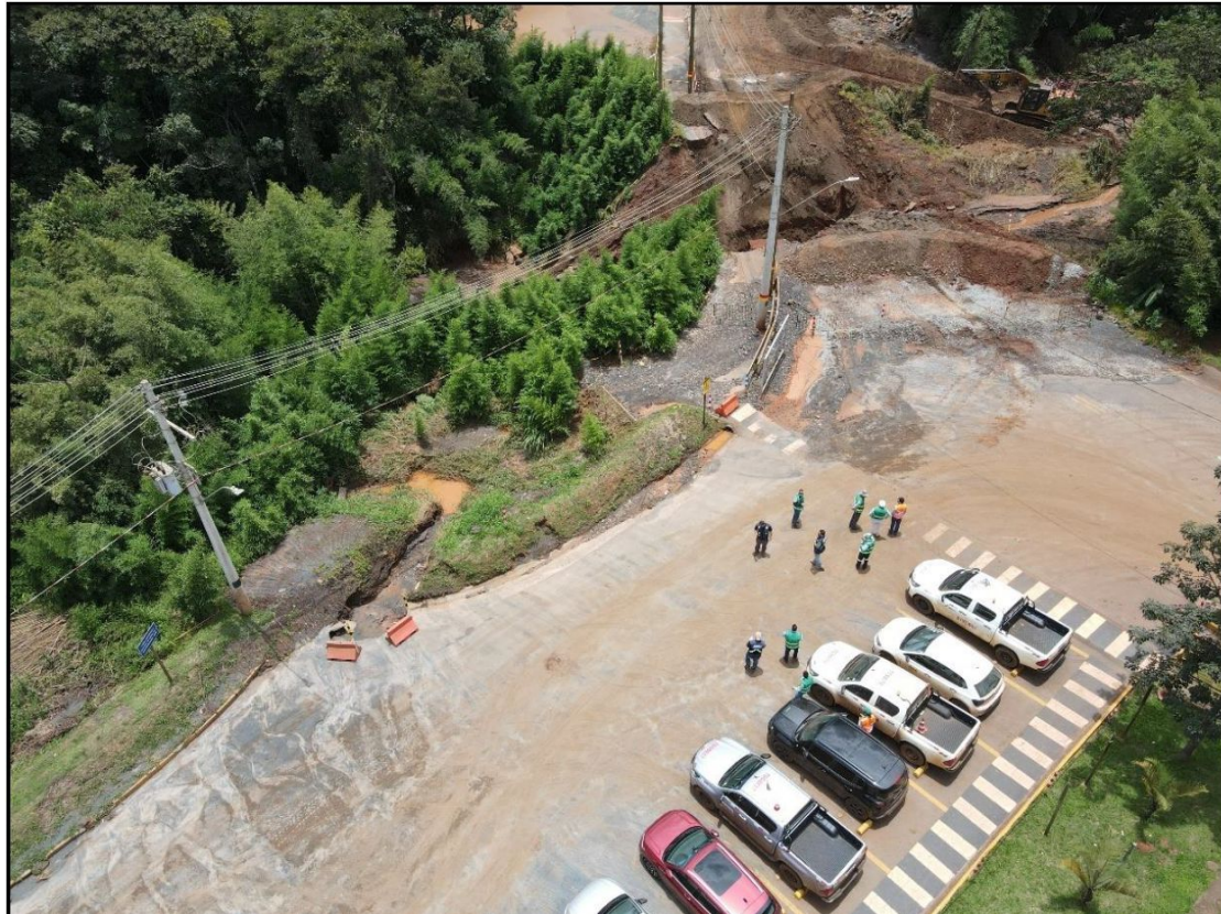
Figura 12 – Estacionamento na Portaria 2 e acima assoreamento do leito do Córrego Maria José

Fonte: AECOM. Nota Técnica 60701789-ACM-DM-ZZ-TN-PM-0009-2026, p.10.