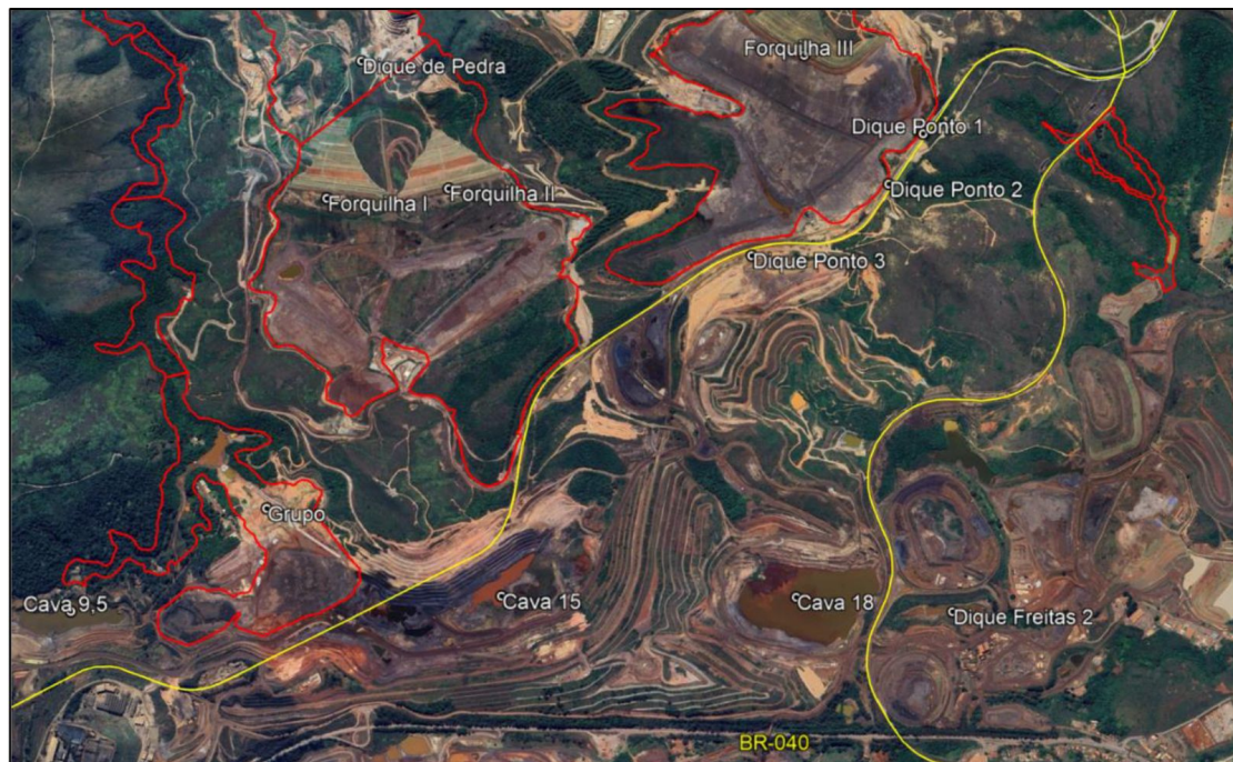
Figura 4 – Complexo minerário Mina de Fábrica – Vale S.A.