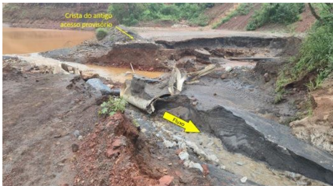
Figura 6 – Acesso provisório rompido na Cava Segredo Área 18