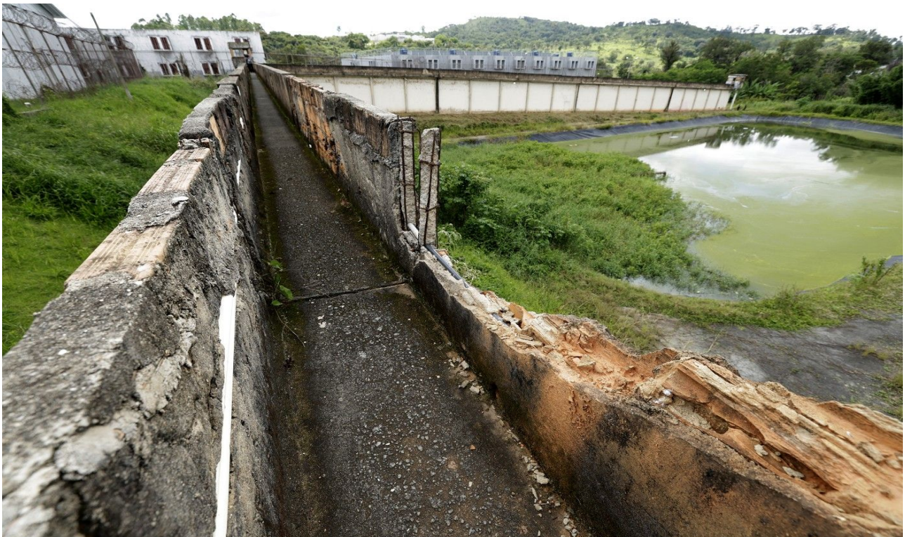
Mureta do passadiço – Anexo 2