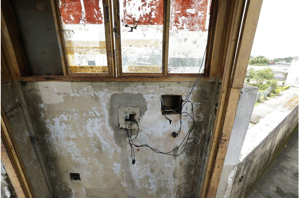
Parte interna de uma das guaritas do Anexo 2