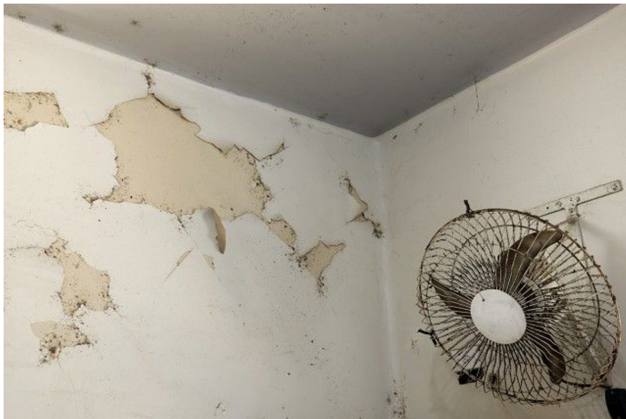
Parede e ventilação