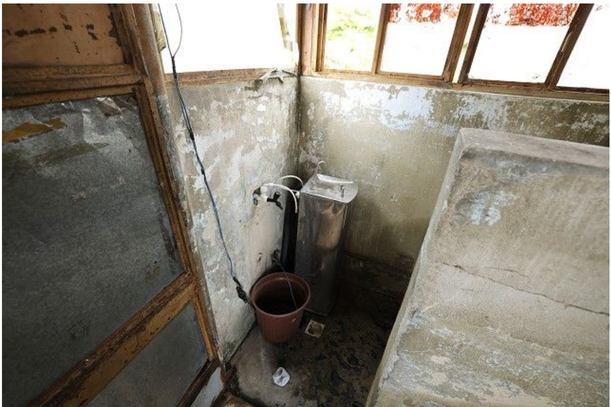
Parte interna de uma das guaritas do Anexo 2