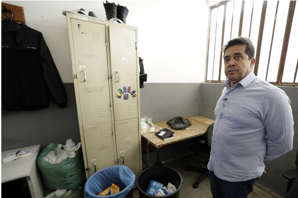
Instalações – Sala de Censura