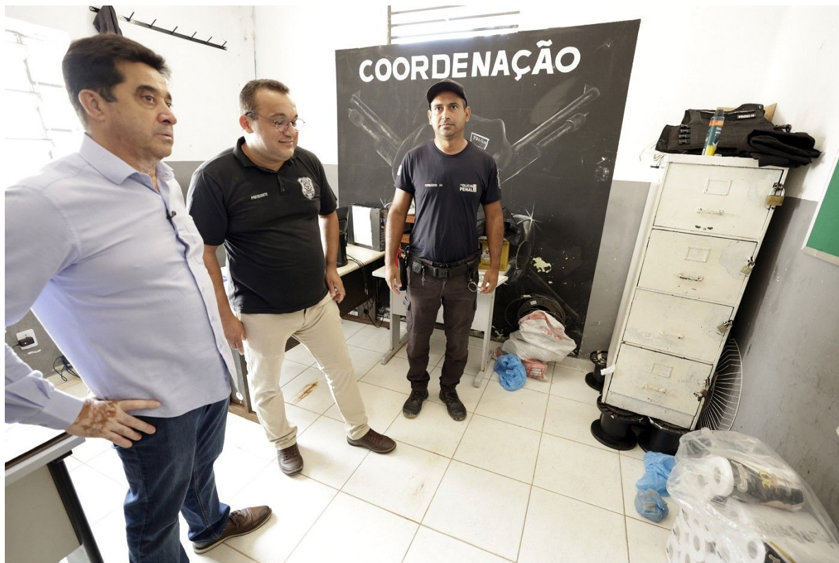
Sala da Coordenação e arquivo