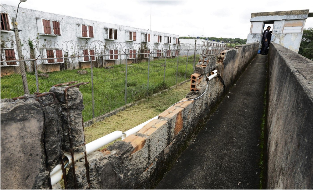
Mureta do passadiço – Anexo 2