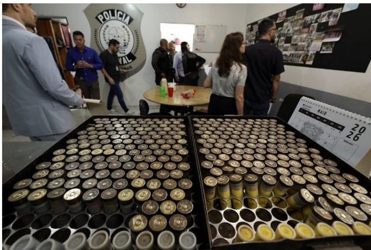
Munição nas instalações do GIR

1 Respectivamente, Requerimentos de Comissão n°s 20.200, 20.202, 20.201, 20.199 e 20.198/2026, aprovados na 3ª Reunião Extraordinária da Comissão de Segurança Pública, realizada em 17/3/2026.