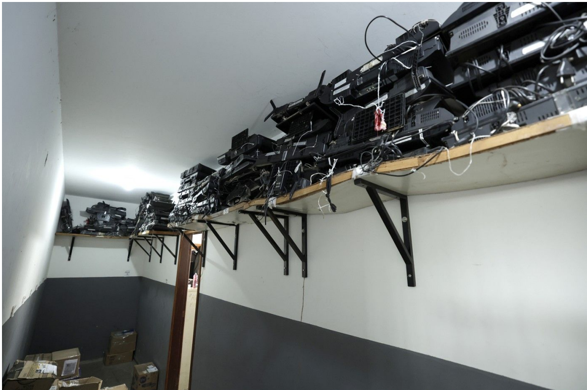
Prateleiras cedendo e aparelhos de TV deixados por ex-detentos – Sala de Censura