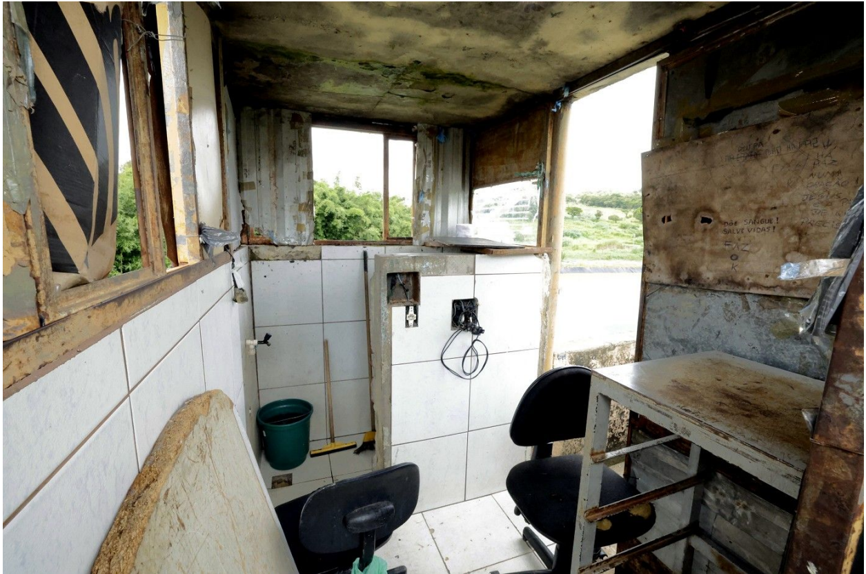
Parte interna de uma das guaritas do Anexo 2