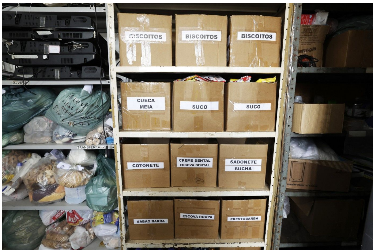
Instalações – Sala de Censura