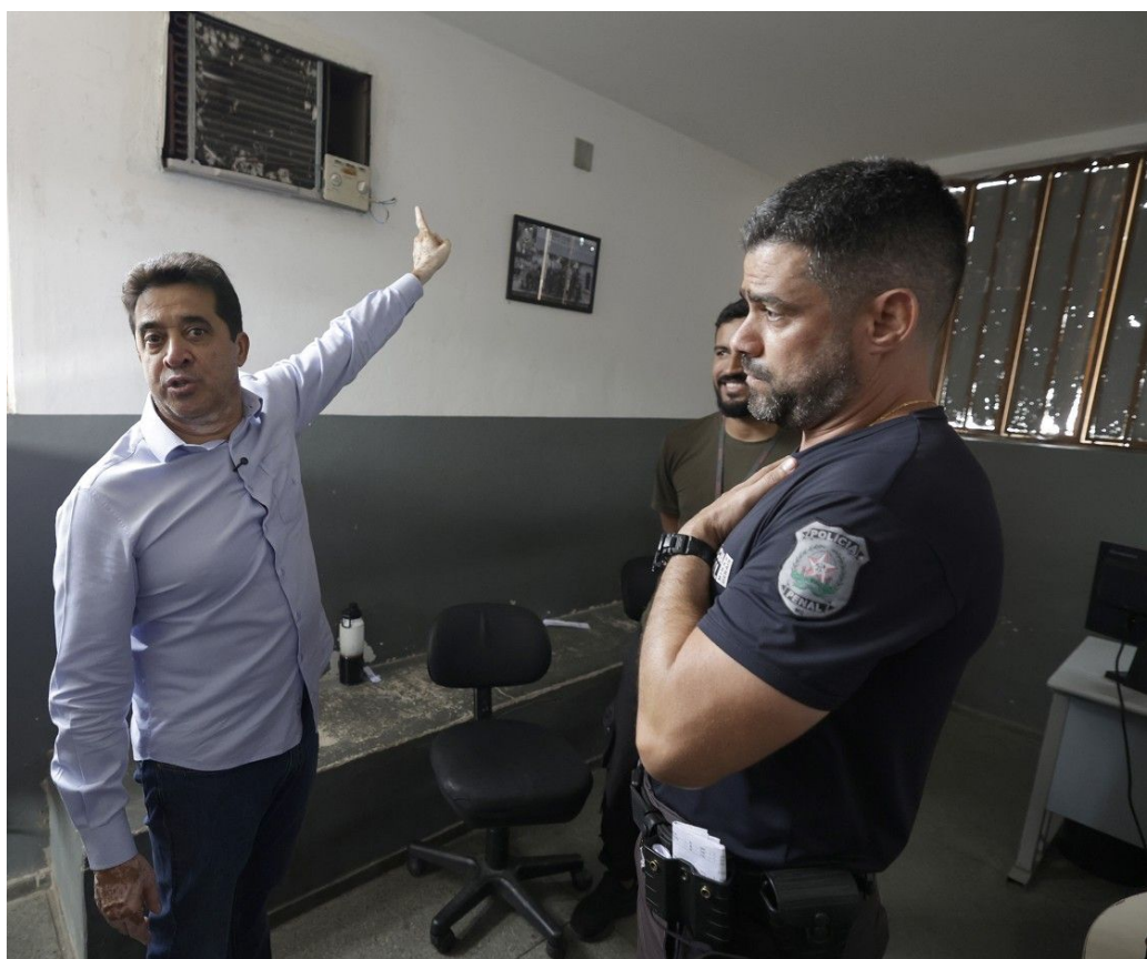
Ventilação, iluminação e janelas – Base de Trânsito Interno