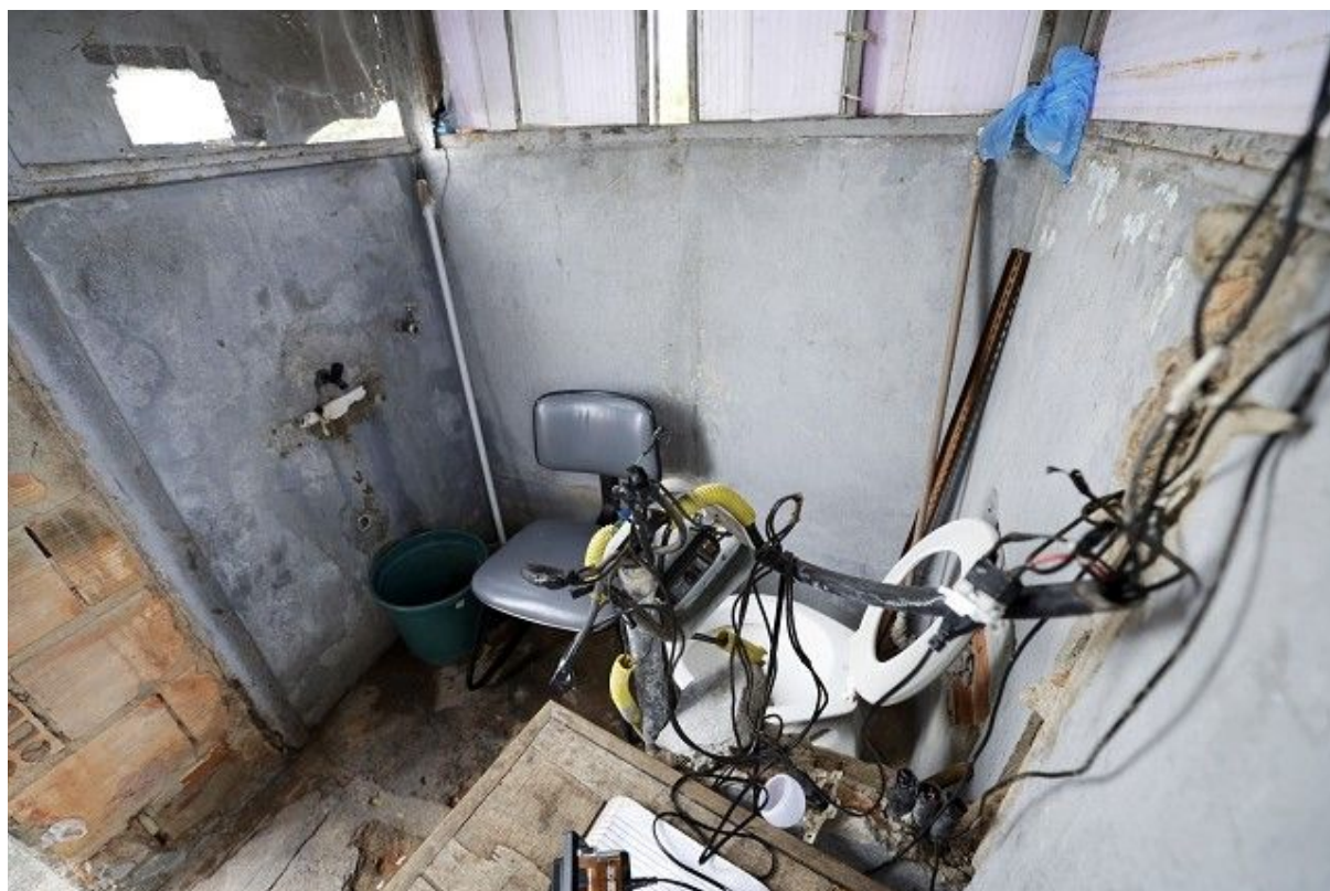
Parte interna de uma das guaritas do Anexo 2