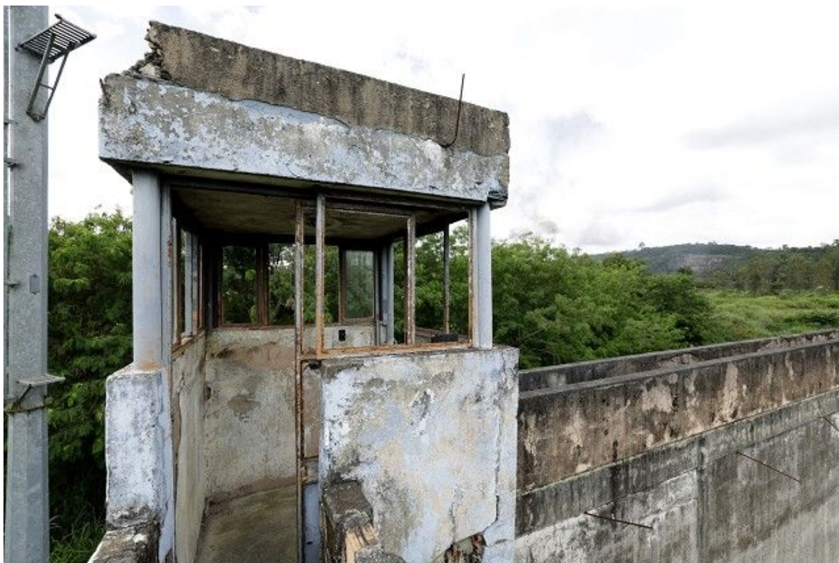
Vista externa de uma das guaritas do Anexo 2